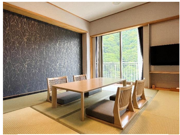
8畳の和室と23㎡の洋室からなる和洋室。