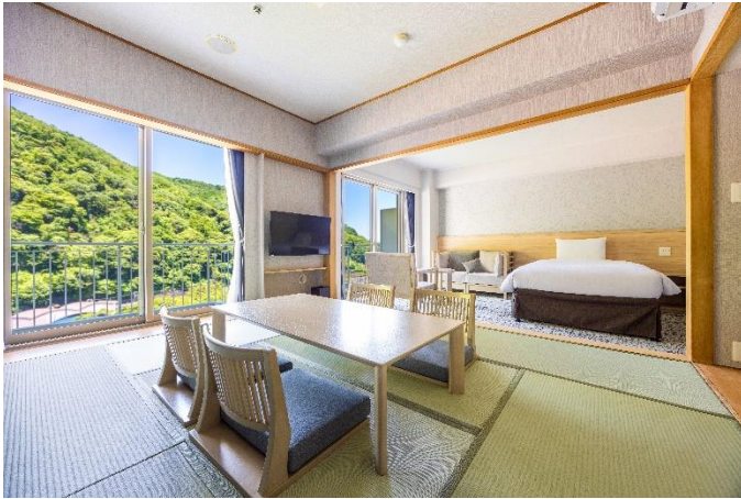
和室・洋室の間には間仕切りがなく 広々とした開放感ある客室。

機能面では、それぞれ独立した洗面台、トイレ、バスルームの新装、個別空調への変更、サッシ交換による断熱、遮音性の向上、ベッドは上質な寝心地で定評のある「Serta(サータ)」のセミダブルサイズを採用するなど、居住性への充実を図りました。最大6名までご滞在が可能、利用シーンや人数に応じてフレキシブルにご利用いただけますので、ご家族や友人グループなど幅広いシーンでのご旅行におすすです。また、和室の雰囲気とベッドの快適性を兼ね備えた和洋室は、海外のお客様からも人気が高い部屋タイプです。和洋室は全48室、本館5階から8階に位置し、2024年3月には6階の全12室を改装済み、また7月下旬には6・7階に続き8階全12室もリニューアルオープン予定です。